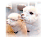
つがいのアルパカ