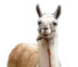
近くある室堂山小動物園のラマ