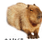
カピバラもいるよ

※火気厳禁、無人の場所取り禁止、ゴミは持ち帰り、カラオケ禁止、駐車場無料。競輪・イベント開催時は大変混雑する