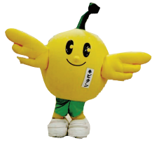
福島県の キビタン

ちなみに…… ちなみに…… とくに関係ありません が、「福島さん」という 方が、全国で最も多い のは埼玉県だそうです。