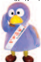
埼玉県の コバトン