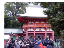
JR「大宮」駅から徒歩15分、東武野田線「北大宮」駅から徒歩5分

■さいたま市 大宮氷川神社 JR「大宮」駅から徒歩15分、東武野田線「北大宮」駅から徒歩5分 全国で最も多いのは「稲荷神社」、次いで「八幡神社」、三番目に多い「氷川神社」は、関東一円に多く、埼玉県には約160社あると言われています。中でも、埼玉県さいたま市にある大宮氷川神社は有名で、東京都・埼玉県近辺にある氷川神社の総本社です。大宮公園は100年の森と言われるだけあって、樹木がとても大きく、また、文人にも愛された場所であると言われています。 三が日の人出が200万人 というデータもあり、屋台なども建ち並んで賑わいをみせます。