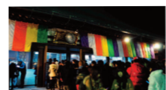
JR「高麗川」駅から徒歩20分、JR「高麗川」駅から徒歩20分

■川越市 喜多院 JR&東武東上線「川越」駅から徒歩20分、西武新宿線「本川越」駅から徒歩15分 喜び多い、と書いて「喜多院」。天台宗の寺院で1200年近くの歴史を持ちます。「川越大師」とも呼ばれ、三が日は隣にある「成田山川越別院」と共に大変賑わいます。