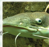
巨大ナマズに見つめられます。

東京電力は、原発事故発生時に避難指示区域内の建物に家財を所有していた方を対象に、避難にともない発生したと想定される家財の損害を世帯人数・家族構成ごとに定額(詳細はご確認ください。)にて賠償するとしています。また、実際の損害総額が定額を上回ると想定される場合については、別途、個別評価による賠償方法を選択できるとしています。