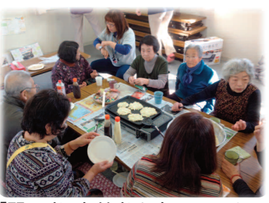
「弱者、高齢者を守るという一点は、譲りませんでした」

●「みんなで決めるということ」 この仮設住宅でより良く生活をしていくかのために、自治会長として最初の1年間は苦労しました。しかし、今は、様々なことがうまく回り出して、私は何もやっていません(笑)。 震災前、富岡町にいたときは、区長をやっていました。が、その経験が今回の震災で生きたと思います。人々を良い方向にまとめていくことの本質は、そう変わるものではないのかもしれないですね。今までと違う場所で、違う