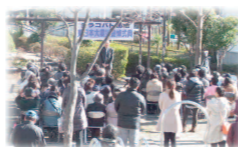
昨年の黙祷の会の様子

東日本大震災発災から三度目の黙祷式典を開催します。同じ想いを持つ方々のご参会を賜りますようご案内申し上げます。