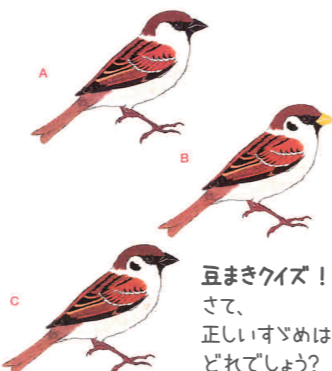
豆まきクイズ! さて、正しいすゝめはどれでしょう?

福玉便りの発送は、編集部の面々でばたばたやっています。手も動かしますが、口のほうが多く動いていると言われていました。もし、一緒に作業して下さる方がいらしゃいましたら、ご連絡おまちします。労協048-833-8731まで。