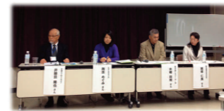
鷺宮都営住宅自治会は、自治会と民生委員がタッグを組

主催:埼玉県ユニセフ協会・埼玉新聞社・坂戸市文化会館 後援:埼玉県、坂戸市、ほか 協力:埼玉りそな銀行・生活協同組合コープみらい埼玉県本部 問合せ:埼玉県ユニセフ協会 048-823-3932