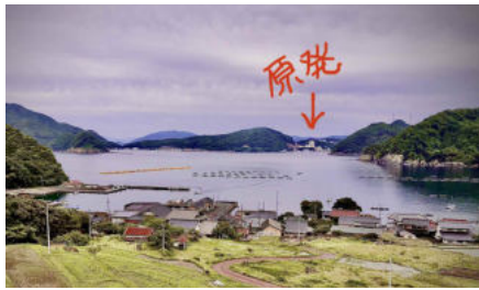
高浜原発が見える集落